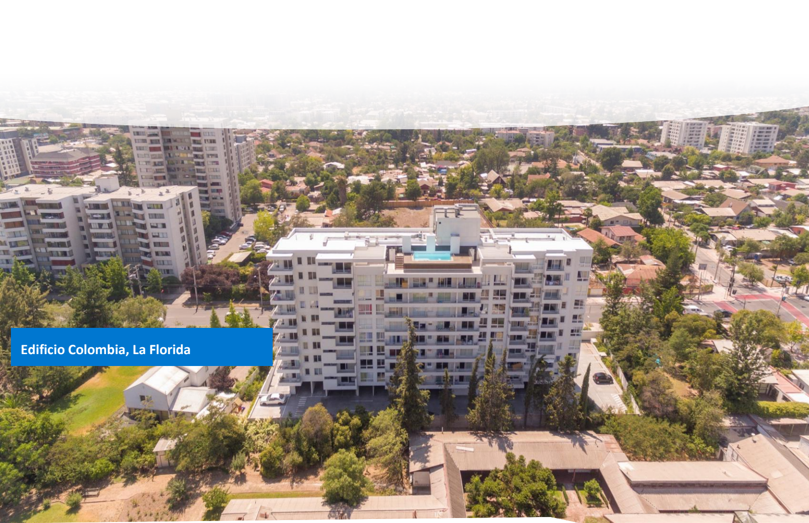
Edificio Colombia, La Florida